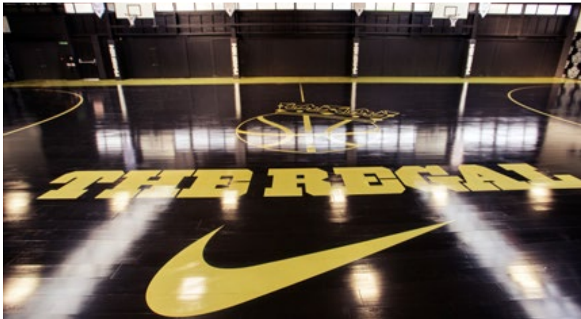
Sportsgulvet i The Regal i Brixton er af sortolieret bøg.

For den danske trægulvsproducent betyder ordren, at Storbritannien er et voksende marked med et lovende potentiale, lyder det fra Junckers.